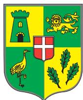
Commune de Barberaz Savoie