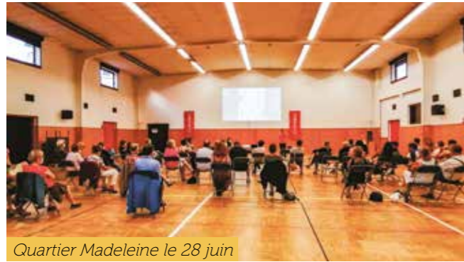
Quartier Madeleine le 28 juin