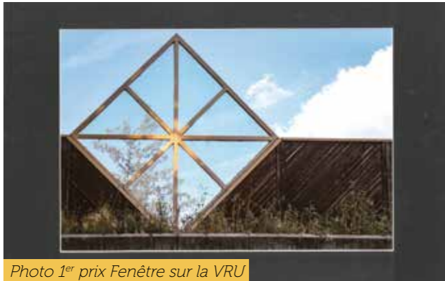
Photo 1 er prix Fenêtre sur la VRU