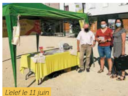
Lelef le 11 juin