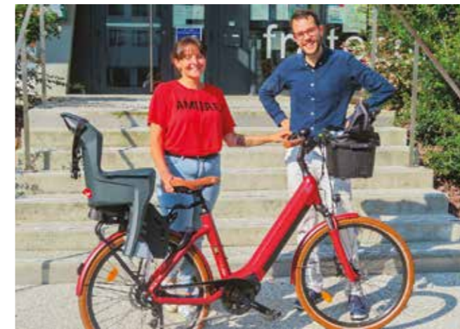
Une habitante avec son nouveau Vélo à Assistance Électrique