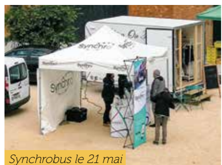
Synchrobus le 21 mai