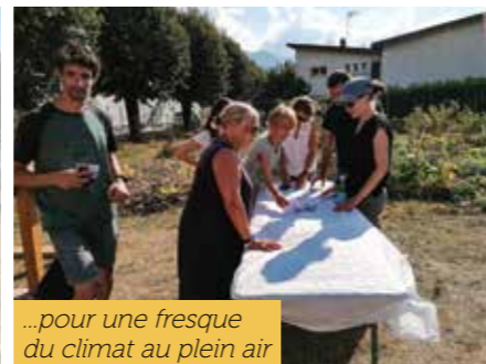
...pour une fresque du climat au plein air