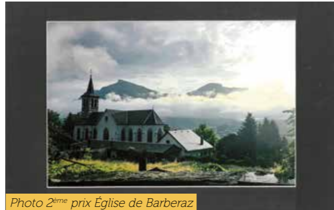
Photo 2 ème prix Église de Barberaz