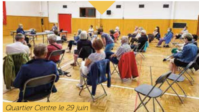
Quartier Centre le 29 juin