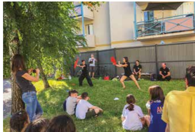
Initiatives à la rencontre - Initiation kung fu