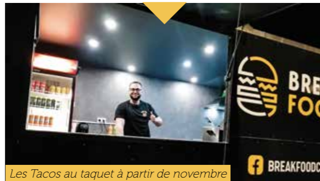
Les Tacos au taquet à partir de novembre