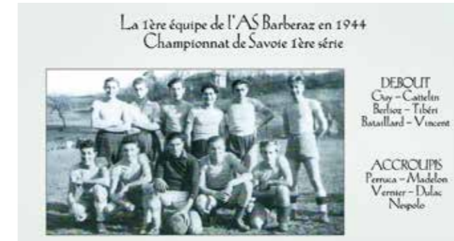
La 1 ère équipe de l'ASB... datant de 1944 !

La plus ancienne association sportive de Barberaz (avec la Boule de la Madeleine), créée en 1943, était en sommeil depuis 2013. L.A.S.B. Football est à nouveau présente sur les terrains savoyards depuis la rentrée 2021 avec notamment deux équipes séniors qui repartaient du bas de l'échelle du district de Savoie (D5), avec la ferme intention d'enregistrer une première montée dès cette année. En quelques mois, le club a enregistré 250 adhésions dont 150 jeunes. Parmi eux, une équipe féminine a également été constituée.