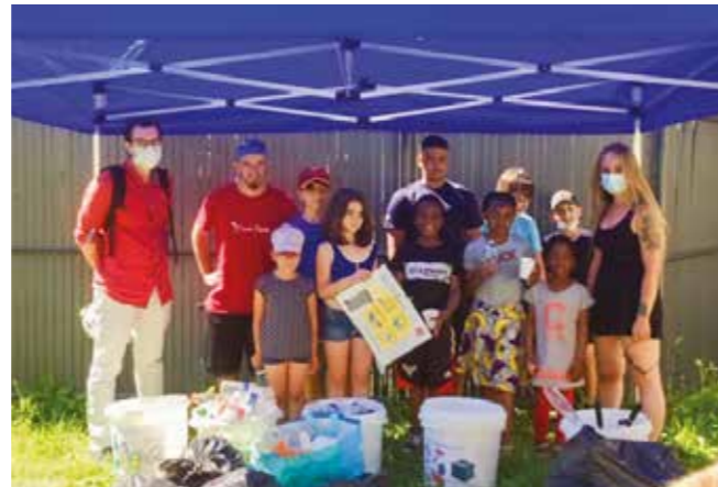
Initiatives à la rencontre - Tri des déchets

Les nouveaux locaux permettront de diversifier leurs nouvelles activités en 2022