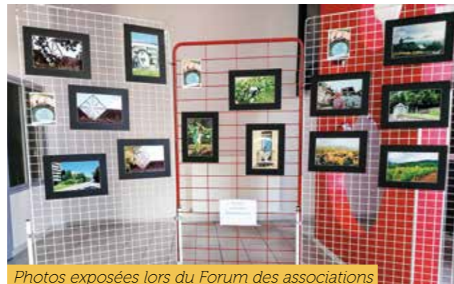
Photos exposées lors du Forum des associations