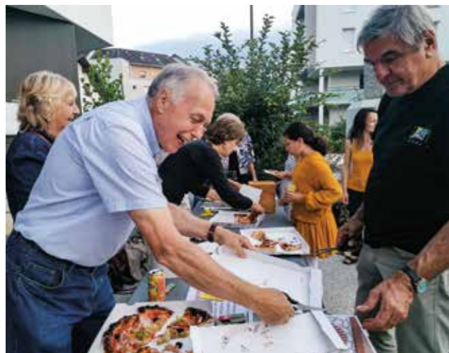
Élus et membres du CAB mis à contribution pour distribuer pizzas et boissons

La mairie a offert boissons et parts de pizza (de l'As de Pizz, Route d'Apremont) aux barberaziennes et barberaziens pour pallier l'absence de foodtruck lors de la soirée.