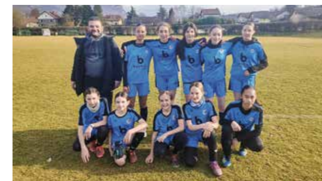
Une des équipes de champions en herbe et les futures grandes championnes du club