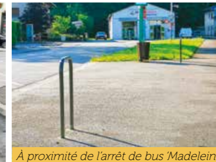
À proximité de l'arrêt de bus 'Madeleine'