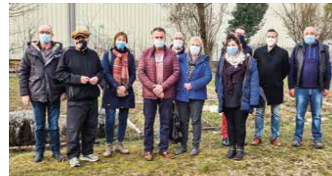
Six élus barberaziens sur la photo, à vous de les retrouver !

En février les élus de Barberaz ont rencontré des élus barbyziens dans un cadre champêtre !