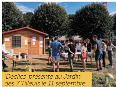
'Déclics' présente au Jardin des 7 Tilleuls le 11 septembre...