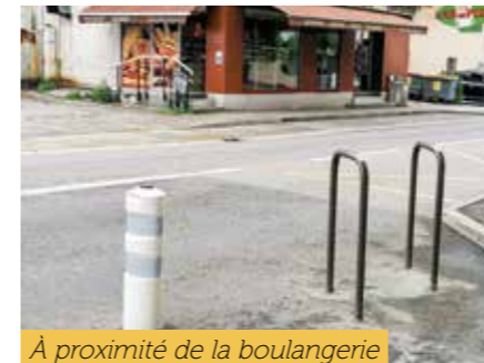
À proximité de la boulangerie