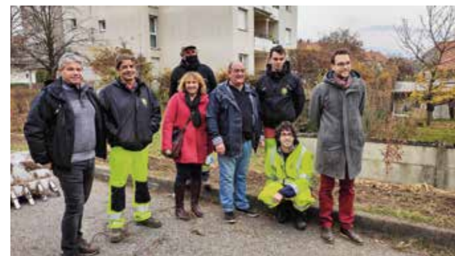
Le maire, les agents et des élus en charge de la végétalisation posant derrière la galerie de la Chartreuse, où plusieurs arbres ont été plantés

Bien d'autres lieux de plantation ont été identifiés. Les priorités et les solutions sont encore à définir avec les habitants pour des plantations réparties sur les prochaines années.