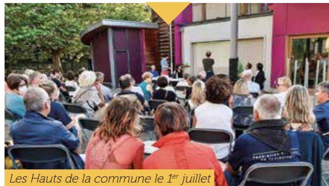
Les Hauts de la commune le 1 er juillet