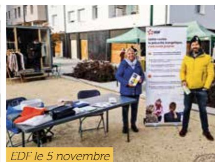
EDF le 5 novembre