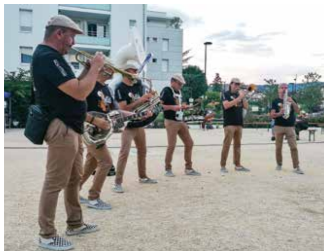
Cocktail De Zik a animé la soirée avec l'AMEJ

En collaboration avec Grand Chambéry, la mairie a souhaité que deux séances en plein air aient lieu au cours de l'été 2021 : • Le 17 juillet , projection du film d'animation « Azur et Asmar » sur la place de la mairie : une fable humaniste qui suit le parcours de deux jeunes hommes que tout oppose. Applaudi par près de 150 personnes, ce film adapté du roman de Michel Ocelot, venait clore une soirée qui avait débuté avec une déambulation musicale assurée par l'orchestre de rue chambérien « Cocktail de Zik » et des animations proposées par l'AMEJ centre social.