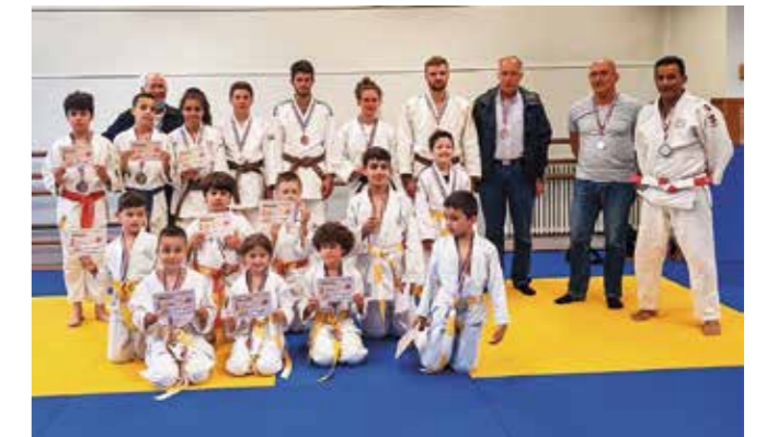
Remise de grades du 8 juillet 2021