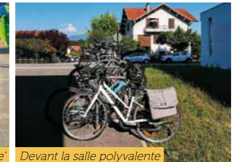
Devant la salle polyvalente