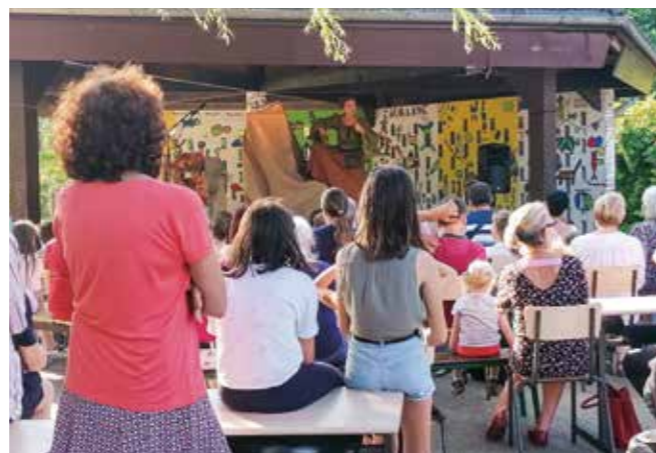
L'Ours perché à l'école Albanne le 21 juillet