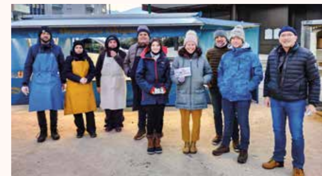
Voeux de la bonne année 2022 aux commerçants fidèles de l'année 2021

En 2022 la présence d'animations ponctuelles lors des marchés hebdomadaires sera renouvelée (musiciens, artistes de rue, associations barberaziennes...).