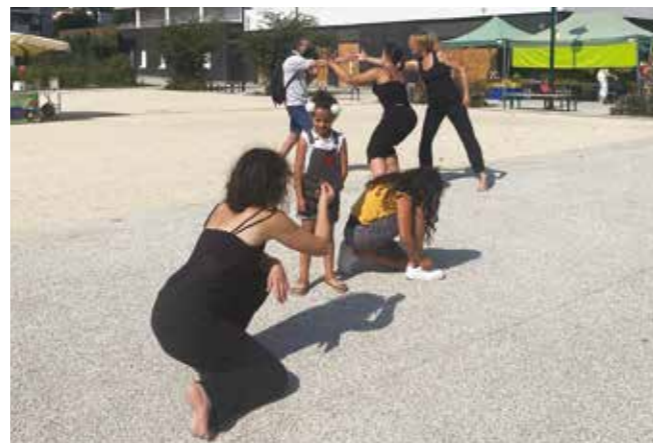
Initiatives à la rencontre - Expression théâtrale