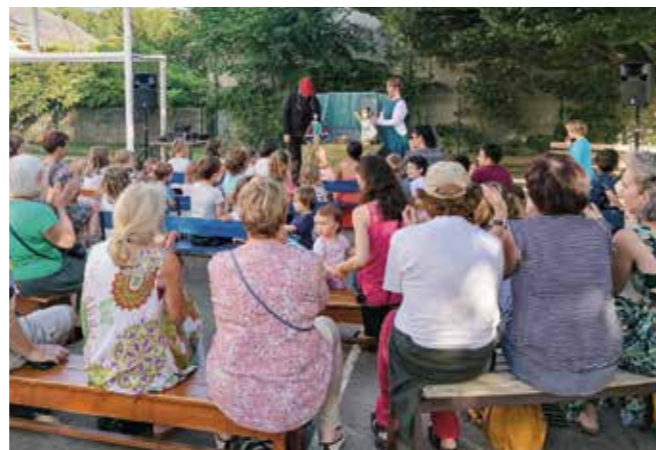
Spectacle de marionnettes du 19 juillet à l'école Concorde