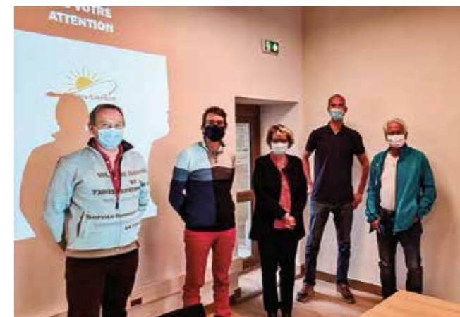
Visite à Montmélian sur le thème de la transition écologique