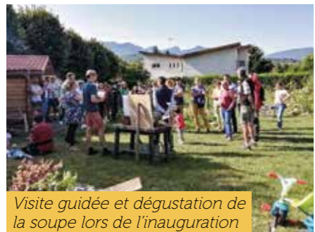
Visite guidée et dégustation de la soupe lors de l'inauguration