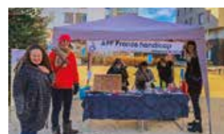
Ventes de petites décorations de Noël faites main par les résidents sur le marché en décembre 2021

Il a été évoqué également leur projet culturel « Regarde moi dans les yeux » voyant le jour en mai 2022, notamment par une représentation théâtrale le vendredi 6 mai à dans la grande salle polyvalente. C'est dans l'objectif d'auto-financer une partie de ce projet que le collectif du SAJ a organisé des ventes de petites décorations de Noël faites main par leur soin, sur le marché en décembre 2021.