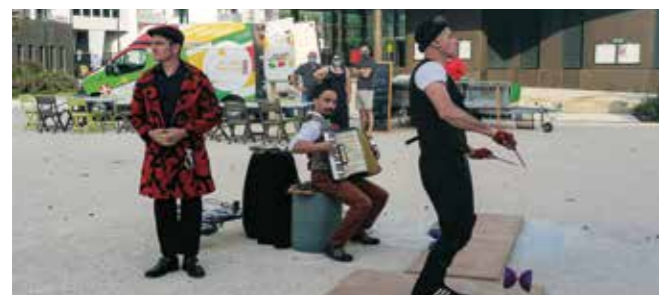
La compagnie SOLFASIRC le samedi 12 juin