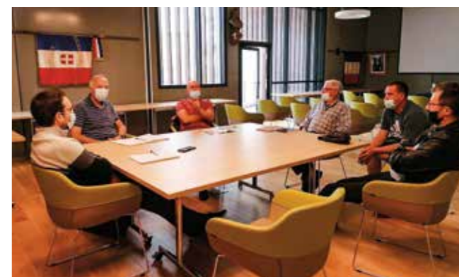
Rencontre avec les chasseurs en septembre 2021

En septembre, le maire a souhaité organiser une rencontre avec les chasseurs pour discuter de leurs activités et surtout parler sécurité face à l'inquiétude de nombreux randonneurs et vététistes.