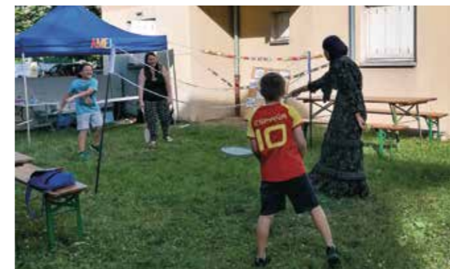
Les parents étaient aussi invités à participer

Le samedi 26 juin après-midi, sur la pelouse située entre les immeubles des « Roseaux » à l'Orée du Bois, une fête a réuni les enfants du quartier accompagnés pour beaucoup par leurs parents.