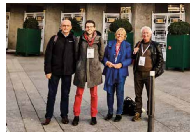
4 élus en première ligne au salon des maires de Paris

Parmi les autres déplacements une délégation de 4 élus s'est rendue au Salon des maires à Paris : participation à de nombreuses tables rondes, contacts avec d'autres communes sur des sujets d'intérêts communs et documentation après de nouveaux fournisseurs étaient au menu de ce week-end bien rempli.