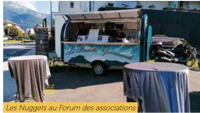
Les Nuggets au Forum des associations