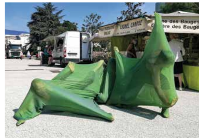
Impromptu sur le marché du 23 juillet

Plusieurs manifestations ont dû être reportées, du fait de l'application des nouvelles règles sanitaires (présentation d'un pass obligatoire à partir du 22 juillet), ou des risques d'intempéries.