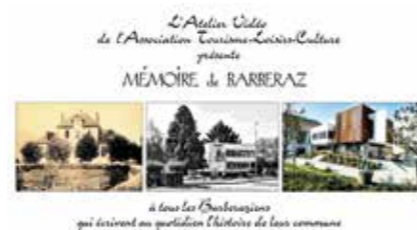
L'écran d'introduction du film présenté par TLC

Par ailleurs, les archives constituées sont à disposition, en consultation, auprès des services communaux.