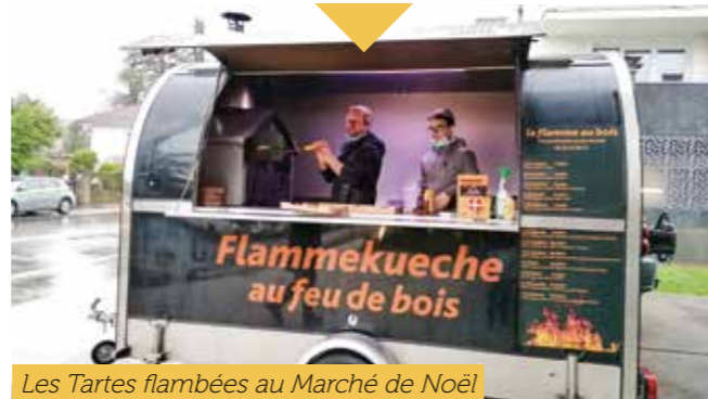
Les Tartes flambées au Marché de Noël