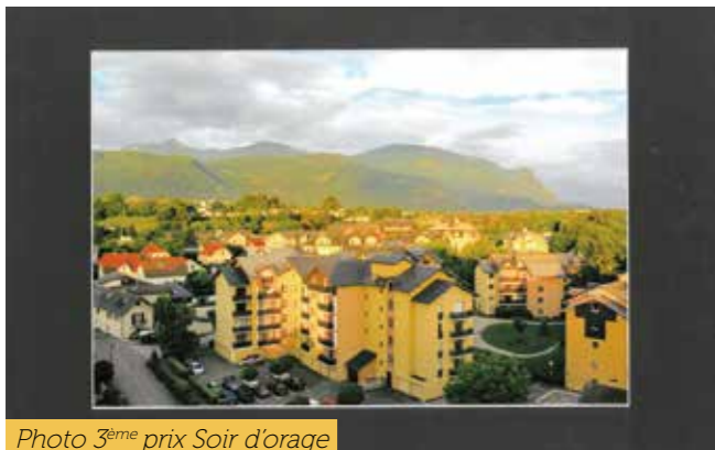
Photo 3 ème prix Soir d'orage