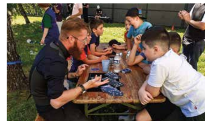
Table d'apprentissage des tours de magie