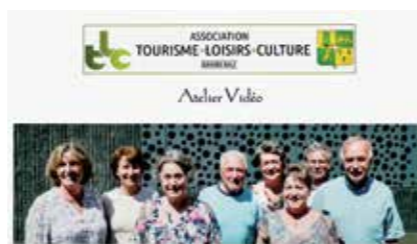
Le groupe TLC vidéo mémoires de Barberaz